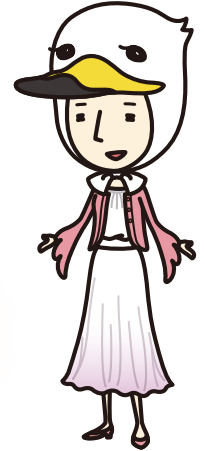
スワンさん 静岡県受動喫煙防止対策 キャラクター