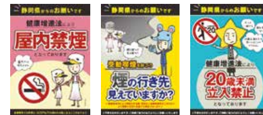
受動喫煙防止啓発デザイン

掲示用ステッカーのデータは静岡県のホームページから無料でダウンロードできます。→ 静岡県 禁煙